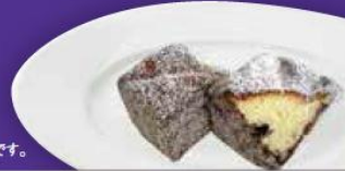
※画像はイメージです。